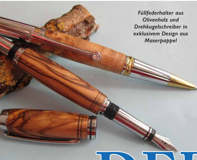
Füllfederhalter aus Olivenholz und Drehkugelschreiber in exklusivem Design aus Maserpappel