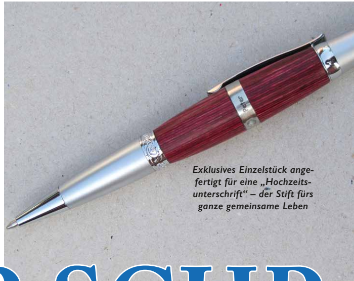
Exklusives Einzelstück angefertigt für eine „Hochzeitsunterschrift“ – der Stift fürs ganze gemeinsame Leben